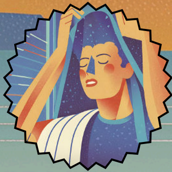
SORI / SUDORI