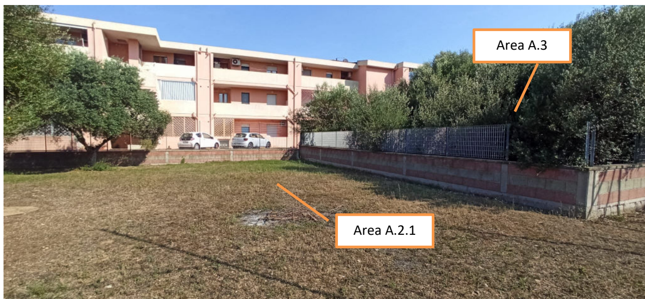
Vista dell'area A.2.1 in concessione alla società "Il Sole Cooperativa Sociale e A.3 di proprietà comunale – lato Olivarium