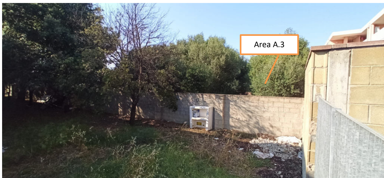
Vista dell'area A.3 di proprietà comunale – lato palestra